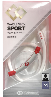
コラントツテ Colan Totte ワックルネック SPORT ABAPS 価格：4,900円（税別）