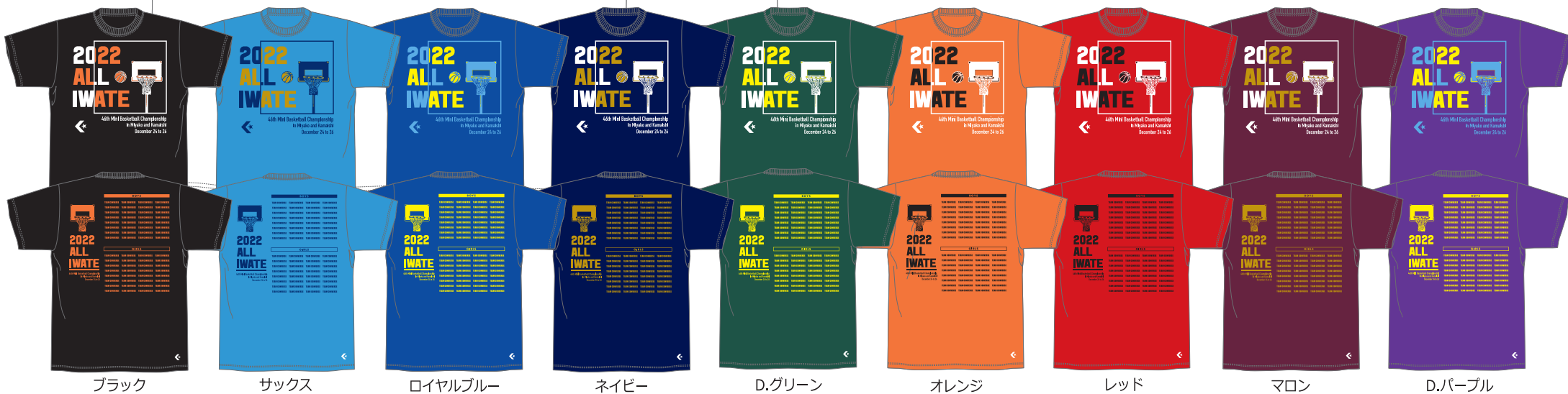
ブラック サックス ロイヤルブルー ネイビー D.グリーン オレンジ レッド マロン D.パープル