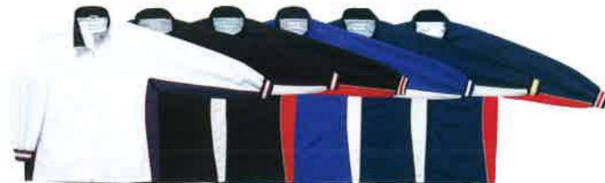
[1129] ホワイト×ネイビー [1911] ブラック×ホワイト [1964] ブラック×レッド [2511] ロイヤルブルー×ホワイト [2911] ネイビー×ホワイト [2964] ネイビー×レッド

ウォームアップジャケット CB 13102S 本体価格 ¥7,300+税 素材/ポリエステル100% (H2OFF) 裏地:トリコット起毛 サイズ/S・M・L・O・XO 着丈75cm (Lサイズ) 原産国/中国製 ※ベンチレーション ●CB14112P・CB142501P(裾ボタン)と組み合わせる事ができます。