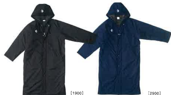
[1900] ブラック [2900] ネイビー

素材/ポリエステル100% (キューダスタフタ) 裏地:メッシュ サイズ/S・M・L・O・XO・2XO 総丈106cm、股下76cm (Lサイズ) 原産国/中国製