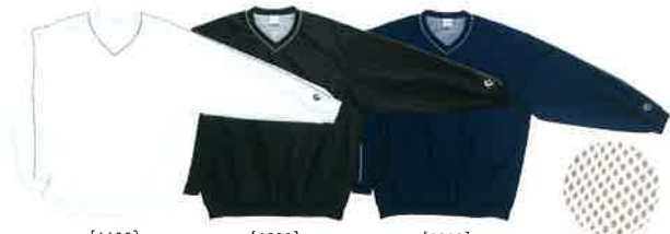
[1100] ホワイト [1900] ブラック [2900] ネイビー 裏地メッシュ仕様

Vネックウォームアップジャケット CB 16510S 本体価格 ¥4,900+税