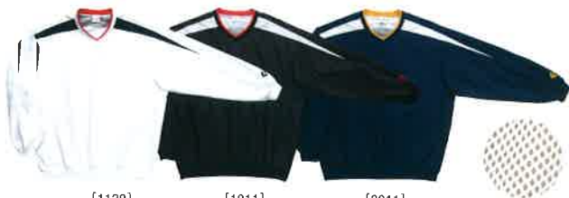
[1129] ホワイト×ネイビー [1911] ブラック×ホワイト [2911] ネイビー×ホワイト 裏地メッシュ仕様

Vネックウォームアップジャケット CB 16508S 本体価格 ¥5,900+税