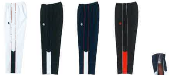
[1129] ホワイト×ネイビー [1911] ブラック×ホワイト [2911] ネイビー×ホワイト [1964] ブラック×レッド NEW COLOR サイドフルオープン

ウォームアップパンツ [サイドフルオープン] CB 18501P 本体価格 ¥7,300+税