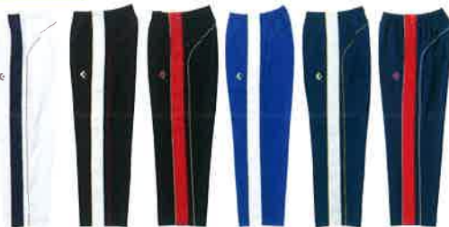
[1129] ホワイト×ネイビー [1911] ブラック×ホワイト [1964] ブラック×レッド [2511] ロイヤルブルー×ホワイト [2911] ネイビー×ホワイト [2964] ネイビー×レッド

ウォームアップパンツ [サイドフルオープン] CB 13102P 本体価格 ¥7,300+税 素材/ポリエステル100% (H2OFF) 裏地:トリコット起毛 サイズ/SS・S・M・L・O・XO 総丈106cm、股下76cm (Lサイズ) 原産国/中国製 ●CB142501Sとも組み合わせる事ができます。