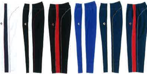
[1129] ホワイト×ネイビー [1911] ブラック×ホワイト [1964] ブラック×レッド [2511] ロイヤルブルー×ホワイト [2911] ネイビー×ホワイト [2964] ネイビー×レッド

ウォームアップパンツ [裾ボタン] CB 14112P 本体価格 ¥5,500+税 素材/ポリエステル100% (H2OFF) 裏地:トリコット起毛 サイズ/SS・S・M・L・O・XO 総丈106cm、股下76cm (Lサイズ) 原産国/中国製 ●CB142501Sとも組み合わせる事ができます。