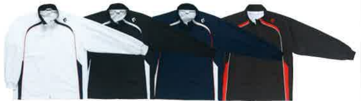
[1129] ホワイト×ネイビー [1911] ブラック×ホワイト [2911] ネイビー×ホワイト [1964] ブラック×レッド NEW COLOR