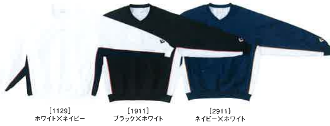
[1129] ホワイト×ネイビー [1911] ブラック×ホワイト [2911] ネイビー×ホワイト

Vネックウォームアップジャケット CB 19112S 本体価格 ¥6,300+税 素材/ポリエステル100% (H2OFF) 裏地:トリコット起毛 サイズ/S・M・L・O・XO 着丈73cm (Lサイズ) 原産国/中国製 ※ベンチレーション ●CB14112P・CB142501P(裾ボタン)もしくは、CB13102P(サイドフルオープン)と組み合わせる事ができます。