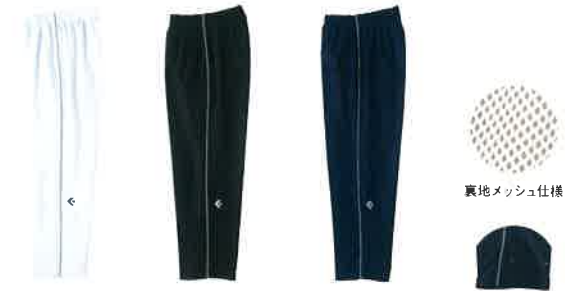
[1129] ホワイト×ネイビー [1911] ブラック×ホワイト [2911] ネイビー×ホワイト 裾ファスナー

ウォームアップパンツ [裾ファスナー] CB 16508P 本体価格 ¥4,900+税