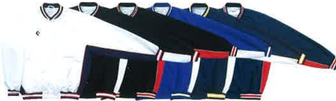
[1129] ホワイト×ネイビー [1911] ブラック×ホワイト [1964] ブラック×レッド [2511] ロイヤルブルー×ホワイト [2911] ネイビー×ホワイト [2964] ネイビー×レッド

ウォームアップジャケット [前ボタン] CB 14112S 本体価格 ¥7,300+税 素材/ポリエステル100% (H2OFF) 裏地:トリコット起毛 サイズ/S・M・L・O・XO 着丈70cm (Lサイズ) 原産国/中国製 ※ベンチレーション ●CB142501P(裾ボタン)もしくは、CB13102P(サイドフルオープン)と組み合わせる事ができます。